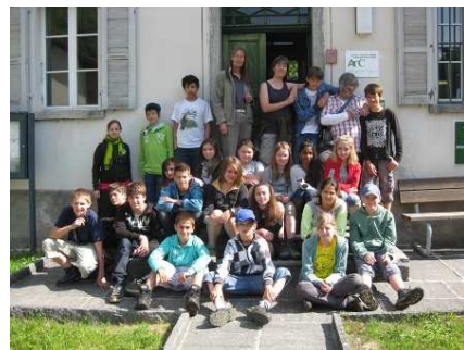
Ex-Schulhaus Cauco 2011: Die Klasse 6b aus Birmensdorf besucht das Archiv