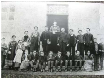
Schulhaus Cauco: Dorfschule 1881

Nach der Anschaffung des EDV-Archivprogramms haben wir mit der Registrierung und teilweisen Digitalisierung der Dokumente begonnen. Eine Aufgabe, die noch sehr viel Zeit in Anspruch nehmen wird. Durch den thematischen Aufbau des ganzen Archivs wird es möglich sein, Informationen zu einem bestimmten Interessengebiet aus allen verfügbaren Unterlagen abzurufen, das heisst aus der Dokumentensammlung, aus den einzelnen Archivalien und aus der Bibliothek.